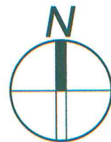
Схема планировочной организации земельного участка